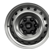
Jantes en Tôle 16"