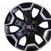
Jantes en alliage Diamond 17"