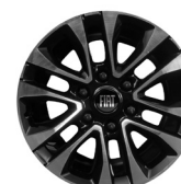
Jantes en alliage Diamond 18"