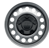
JANTES TÔLE GRISE 15"